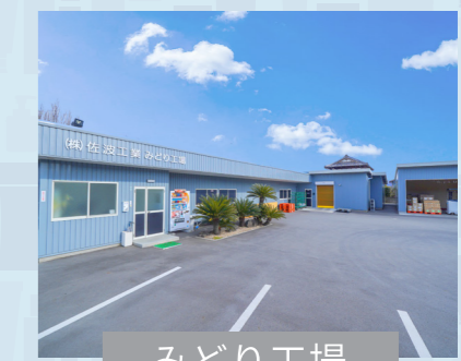
みどり工場 群馬県みどり市笠懸町阿左美2251