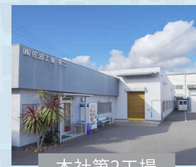
本社第2工場 群馬県佐波郡玉村町大字飯倉11-3