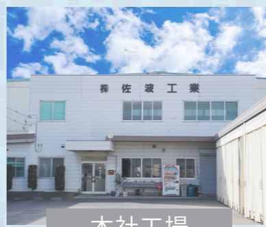
本社工場 群馬県佐波郡玉村町大字飯倉12